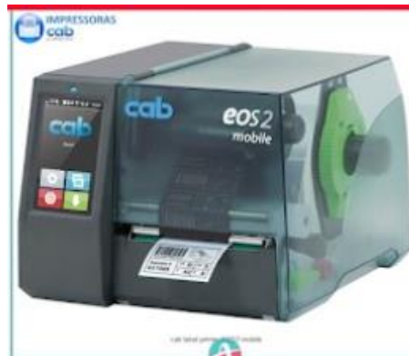
IMPRESSORA CAB EOS2

Mobile printing -EOS2 mobile Na produção, logística ou agricultura, onde quer que os rótulos sejam exigidos e não haja acesso à eletricidade. A tensão de entrada de 24V permite que a impressora seja alimentada por qualquer bateria potente. Para dados técnicos da bateria, consulte os acessórios.