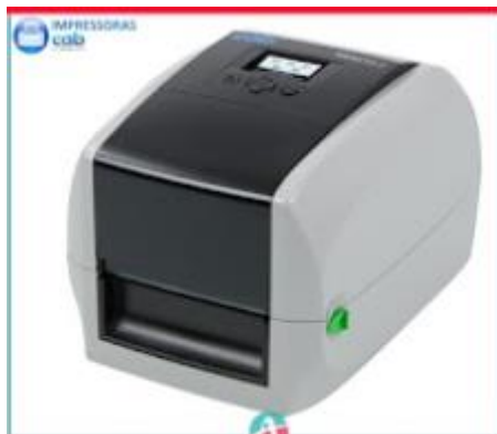
IMPRESSORA CAB MACH 2

Ideal para impressão de pequeno a médio volume Para transferência térmica e impressão térmica direta MACH2 com display LCD colorido e painel de navegação Resoluções de 200/300 dpi Processamento de etiquetas com larguras de até 118 mm