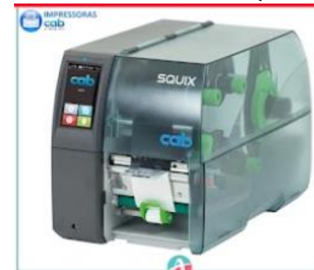
IMPRESSORA CAB SQUIX

As impressoras SQUIX podem ser utilizadas em uma ampla variedade de aplicações. Elas foram desenvolvidas com foco na operação fácil e alta confiabilidade